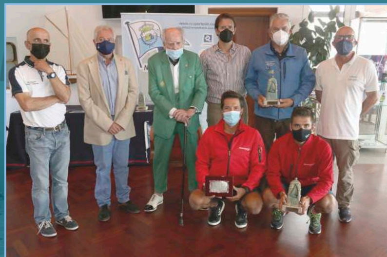
GANADORES DE TODAS LAS CLASES