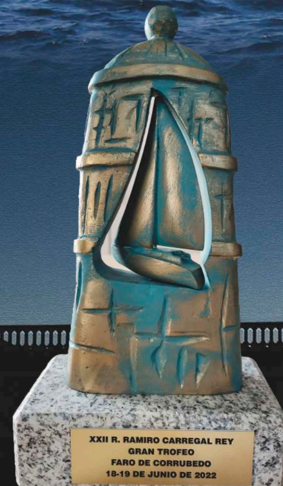
XXII R. RAMIRO CARREGAL REY GRAN TROFEO FARO DE CORRUBEDO 18-19 DE JUNIO DE 2022