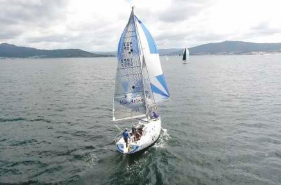
CLASE CRUCERO CAMPING RÍA DE AROSA de José Manuel Pombar